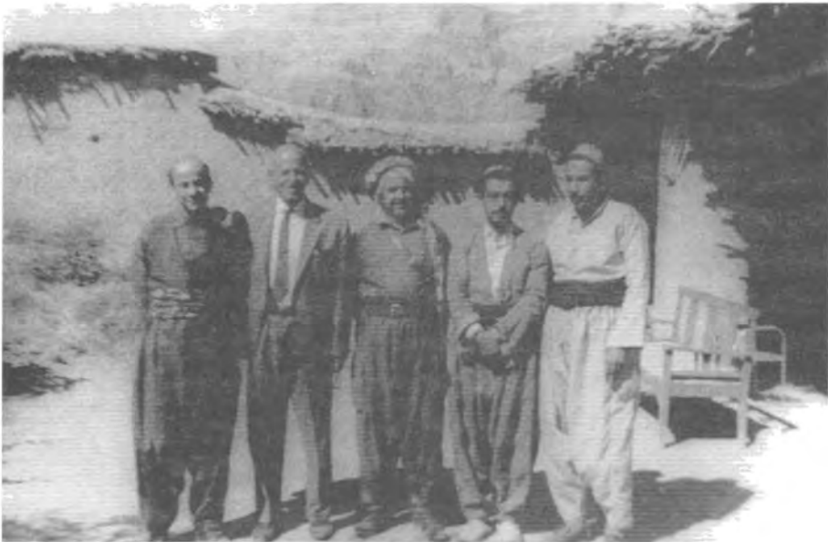
لای راستہ وہ، شہ مسہ دین موفتی، شیخ بابہ تاهیر حہ فید، مام جہلال، ؟، دکہ مال فواد